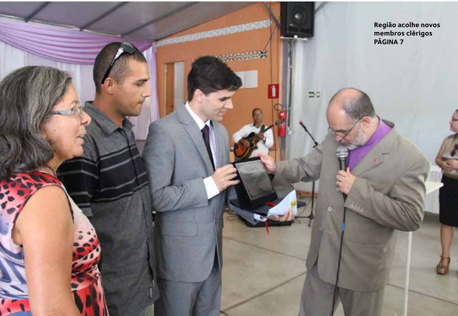
Região acolhe novos membros clérigos PÁGINA 7

Boletim Episcopal da Igreja Metodista • Quarta Região Eclesiástica • Ano 31 • Jan/Fev/Mar de 2014 • nº 346